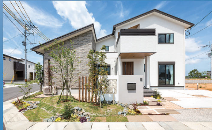
ZEH & IOT スマートハウスの施工例