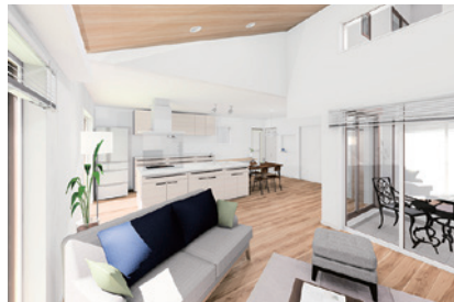
ARCHITREND ZERO で作成したパース