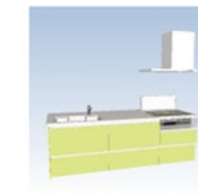
クリナップ フラット対面 左シンク アロマライム (E2E)

対面キッチンでTVを見ながらCOOKING お客様が来ても対面だからコミュニケーションが とりやすい！