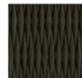
東海機器工業 樹脂表 目積織 ブラック