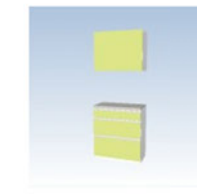
クリナップ ハイフロアカウンター 3段引出しタイプ アロマライム (E2E)