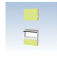
クリナップ ハイフロアカウンター 家電収納庫引出しタイプ アロマライム (E2E)

心地よい香りとやさしい感触で リラックスできる空間を。 自然素材を使用した床材です。