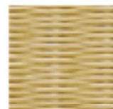
東海機器工業 樹脂表 目積織 ベージュ