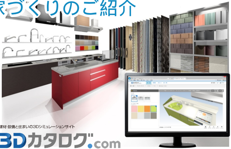
建材・設備と住まいの3Dシミュレーションサイト

ほとんどの施主にとって家づくりは初めてのことばかり。どなたでもWEB上で住まいの検討が可能な3Dシミュレーションサイト「3Dカタログ.com」と業界シェアNo.1の「ARCHITREND ZERO」との融合で、安心・満足の家づくり、新しい住宅提案の形をご提案するセミナーです。