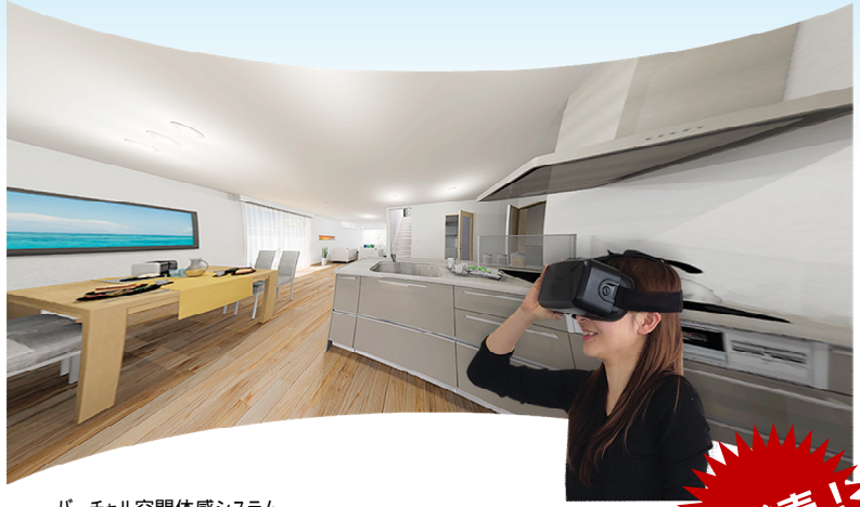
バーチャル空間体感システム

VRゴーグル(ヘッドマウントディスプレイ)を装着すると、そこは「バーチャルリアリティ」の世界。まるで自分がその場に立っているような圧倒的な没入感で、キッチン周りの高さやスペース、リビングなど目線の違いによる空間の広がりなどをリアルに感じることができ、新しい住宅提案が可能になります。様々な業界で注目を集めているVRをぜひご体験ください!