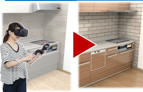
キッチンやクロス、フローリングなどを変更し、 実寸大でコーディネートが可能です。