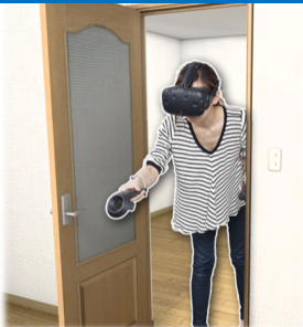
図面では把握しづらい ドアの干渉などをチェック。