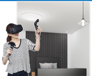
シーリング照明の位置や ダウンライトの取付数の検討も。