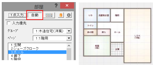
●部屋入力と同時に柱壁・仕上の自動配置