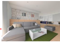
●ワンタッチでイメージ変更