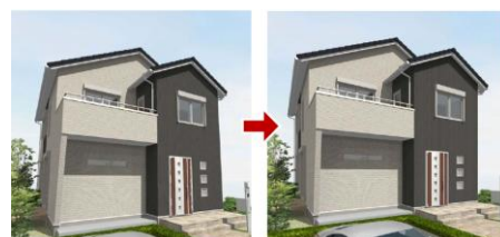
●ワンタッチで見栄え良いアングルに設定

その他、「ARCHITREND リフォームエディション Ver.2」「J-BIM 施工図 CAD 2016」も同日リリース予定です。