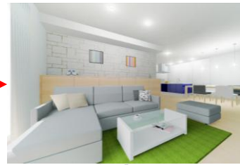
クールなイメージの「クール」スタイルに