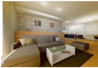
温かみのある「ウォーム」スタイルに