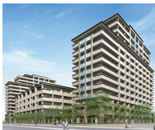
「エレガーノ西宮」外観イメージ

https://www.s-carelife.co.jp/home/nishinomiya/index.html