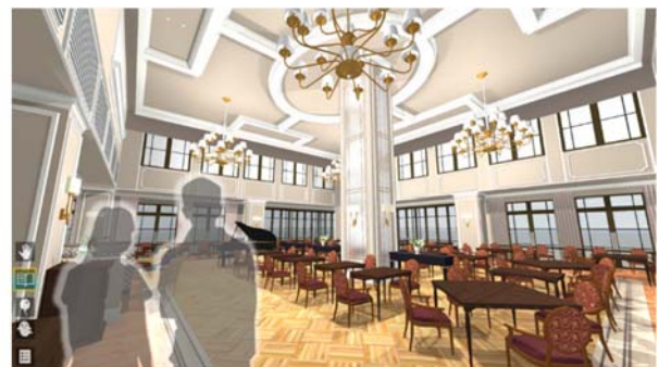
メインダイニングなどの共用部もVRできめ細かく再現