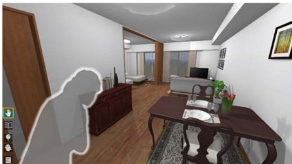
共用部から居室まで豊富なVRコンテンツをご用意