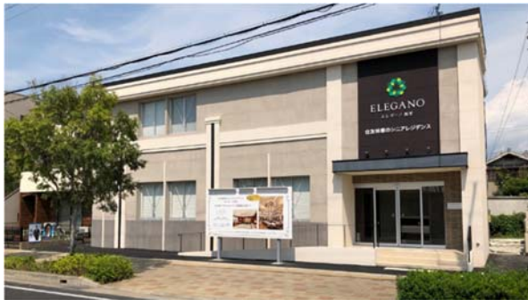
エレガーノ西宮の販売センター「シニアレジデンスギャラリー」

さらに、ゲームコントローラを使って3D空間を自由に歩き回るウォークスルー体験も可能で、検討者のさらなる満足度向上を目指してまいります。