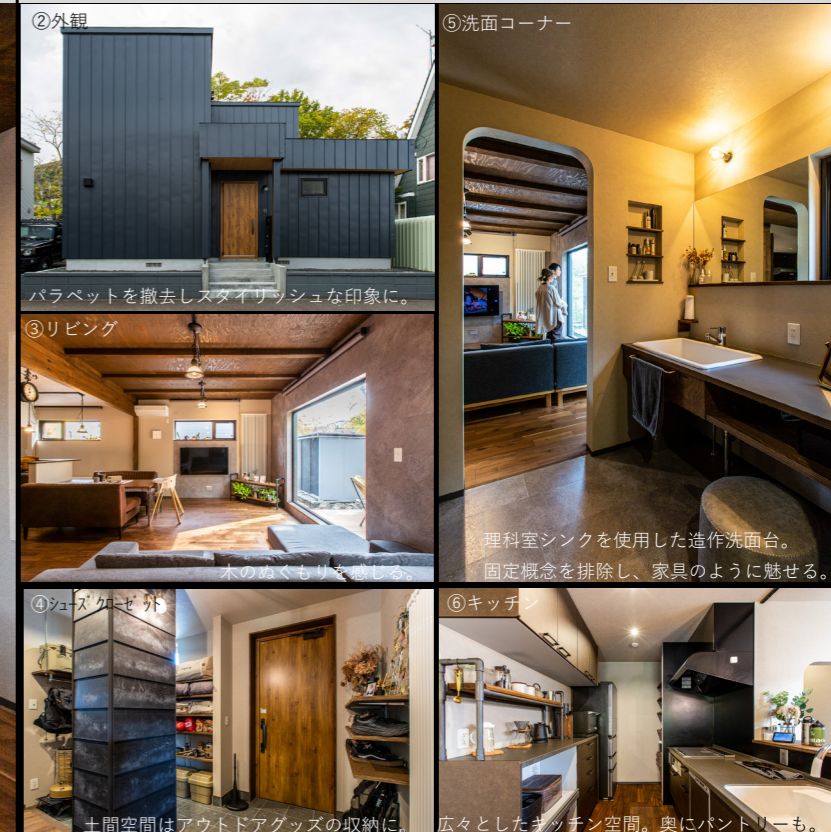
After ※メイン画像以外のパースまたは写真を添付してください (複数可)