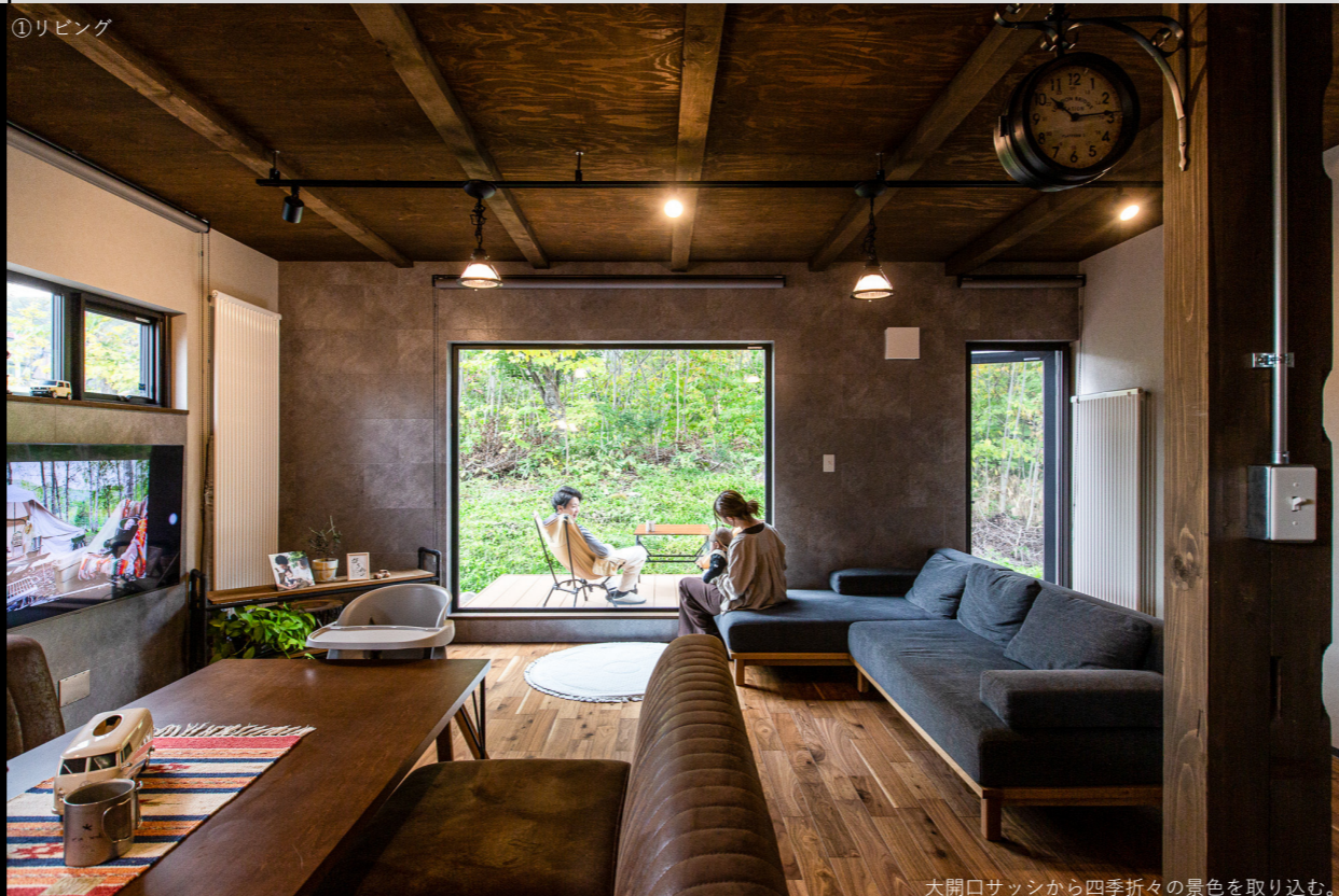
After メイン画像 ※メインとなるパースまたは写真を1枚だけ添付してください。サイトに掲載します。