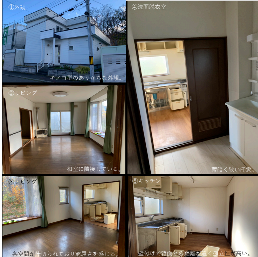
Before ※枠内に写真を添付してください (複数可)