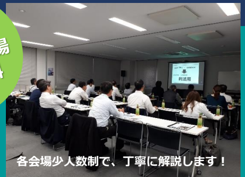
各会場少人数制で、丁寧に解説します！