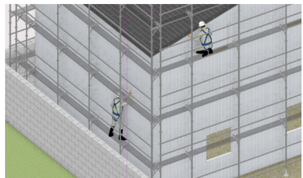
一側足場を新たに追加。狭小地の現場でも計画可能